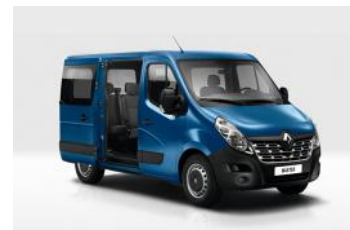
Master Combi (sur commande)