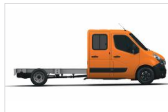
Master Châssis Double Cabine