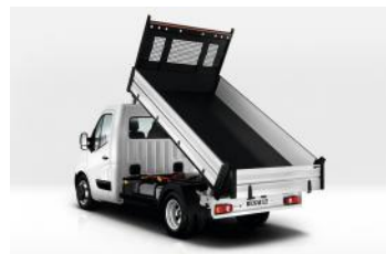
Master Benne Propulsion